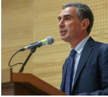
Καθηγητής Νίκος Κατσαράκης Πρύτανης Ελληνικού Μεσογειακού Πανεπιστημίου